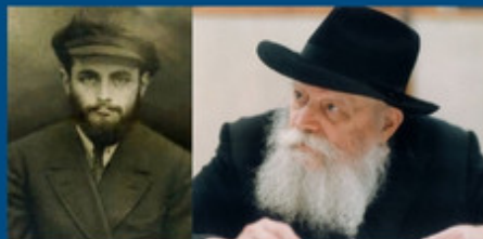
Menachem Mendel Schneerson sel. A. 1941 und 1984